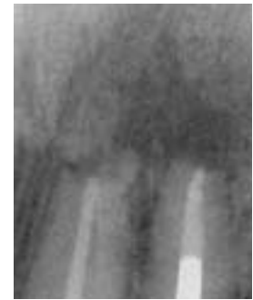
Abb. 9: Röntgenkontrolle 21/22 zwei Wochen postoperativ. – Abb. 10: Röntgenkontrolle 21/22 zwölf Wochen postoperativ. – Abb. 11: Röntgenkontrolle 21/22 sechs Monate postoperativ.