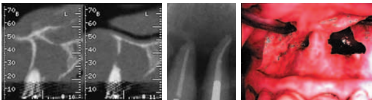
Abb. 1: Zyste Oberkiefer links Regio 21/22, CT. – Abb. 2: Radikuläre Zyste 21/22, Röntgenbild. – Abb. 3: OP-Situation.

Der 51-jährige Patient wies eine kleine radikuläre Zyste am Zahn 11 und eine ca. 20 x 16 mm große Zyste im linken Oberkiefer auf, die die Wurzeln der Zähne 21 und 22 einschloss (Abb. 1 und 2). Nach paramarginaler Schnittführung von 12 bis 24 wurde der vestibuläre Knochen des Oberkiefers dargestellt. Zur Entfernung der Zysten musste lediglich im Oberkiefer rechts eine geringe Menge Knochen entfernt werden. Links war vestibulär der Zyste kein Knochen mehr vorhanden (Abb. 3). Nach Ausräumen der