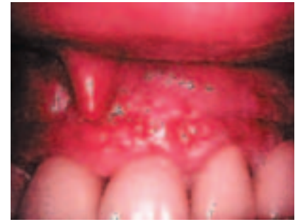
Abb. 7: Wundverschluss und Schiene. – Abb. 8: Zustand nach Nahtentfernung.